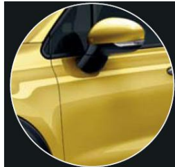
код фарби 831