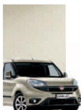
261 - PERLA