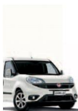
249 - BIANCO