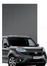
695 - GRIGIO