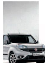
612 - GRIGIO CHIARO