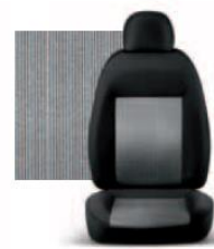
PIN STRIPE GRIGIO 223