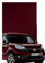
590 - BORDEAUX