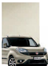
261 - PERLA