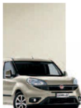
261 - PERLA