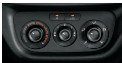
Кондиціонер з ручним регулюванням