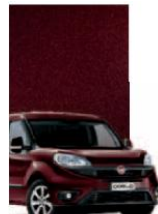
590 - BORDEAUX