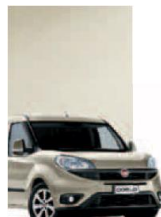
261 - PERLA