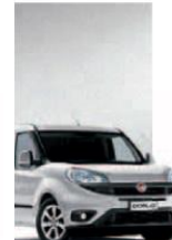
612 - GRIGIO CHIARO