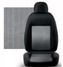
PIN STRIPE GRIGIO 223