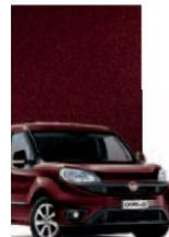
590 - BORDEAUX