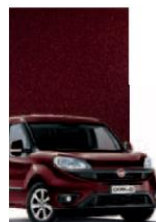
590 - BORDEAUX