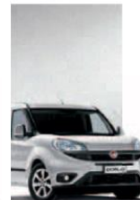
612 - GRIGIO CHIARO