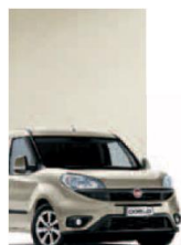
261 - PERLA