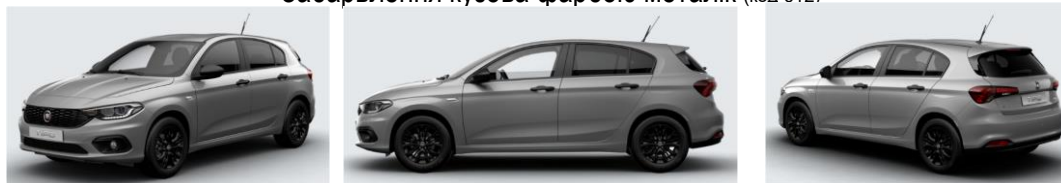
Забарвлення кузова фарбою металік (код 695)