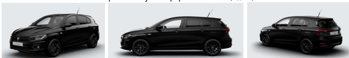
Забарвлення кузова фарбою металік (код 722)