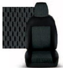
STAR GRIGIO 213