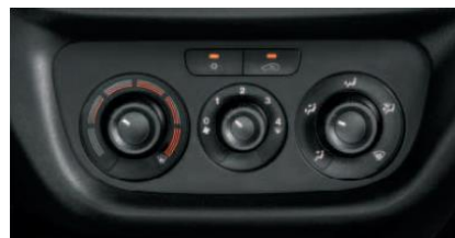
Кондиціонер з ручним регулюванням