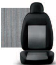
PIN STRIPE GRIGIO 223