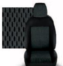
STAR GRIGIO 213

Глуха металева перегородка багажного відсіку