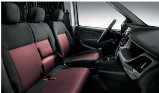
3-х місна версія