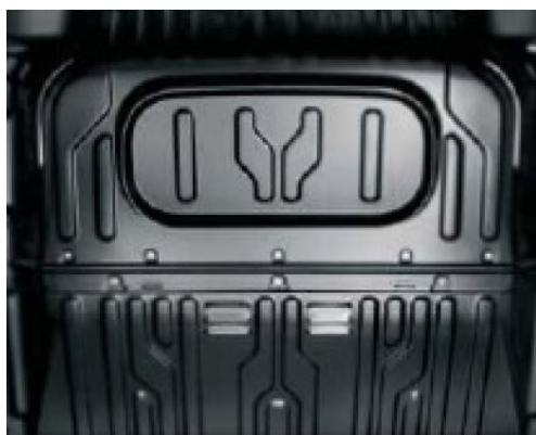
Глуха перегородка для версії з 3-х містим салоном