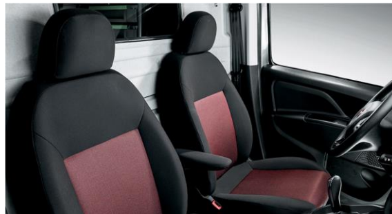
2-х місна версія