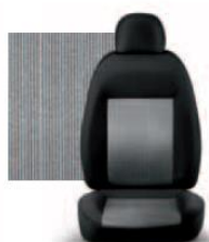
PIN STRIPE GRIGIO 223