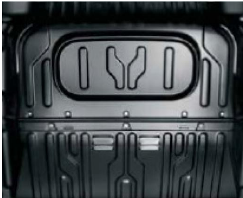
Глуха перегородка для версії з 3-х містим салоном